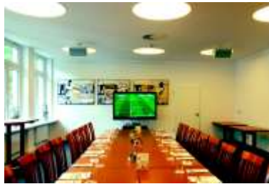
Blocktafel bis maximal 26 Personen