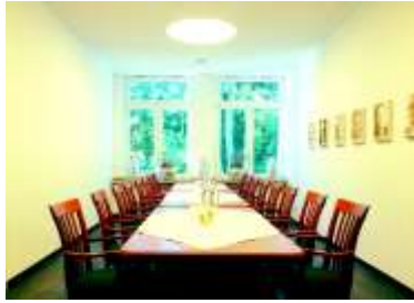
Tischtafel bis maximal 20 Personen