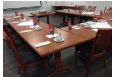
U-Form bis maximal 24 Personen (nur außen bestuhlt)