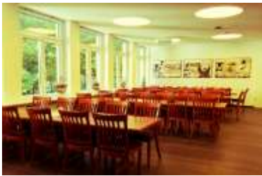
Tischtafeln bis maximal 60 Personen